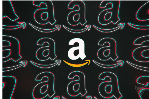
Illustration by Alex Castro / The Verge